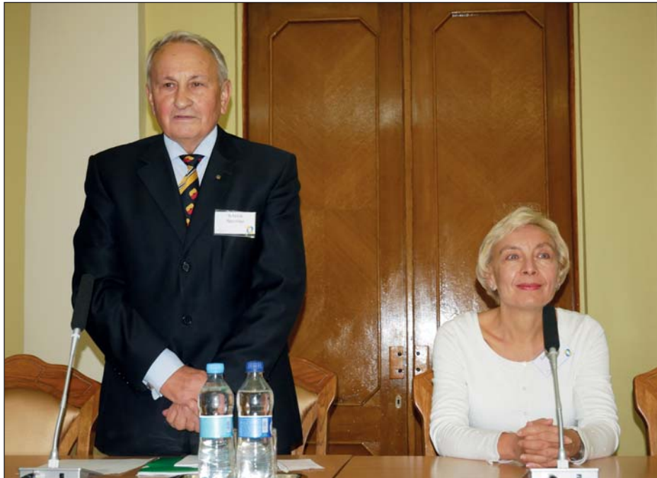
Академік НАН України Я. Яцків та професор О. Гарашук відкривають роботу Форуму наукової діаспори. Київ, 20 жовтня 2018 р.