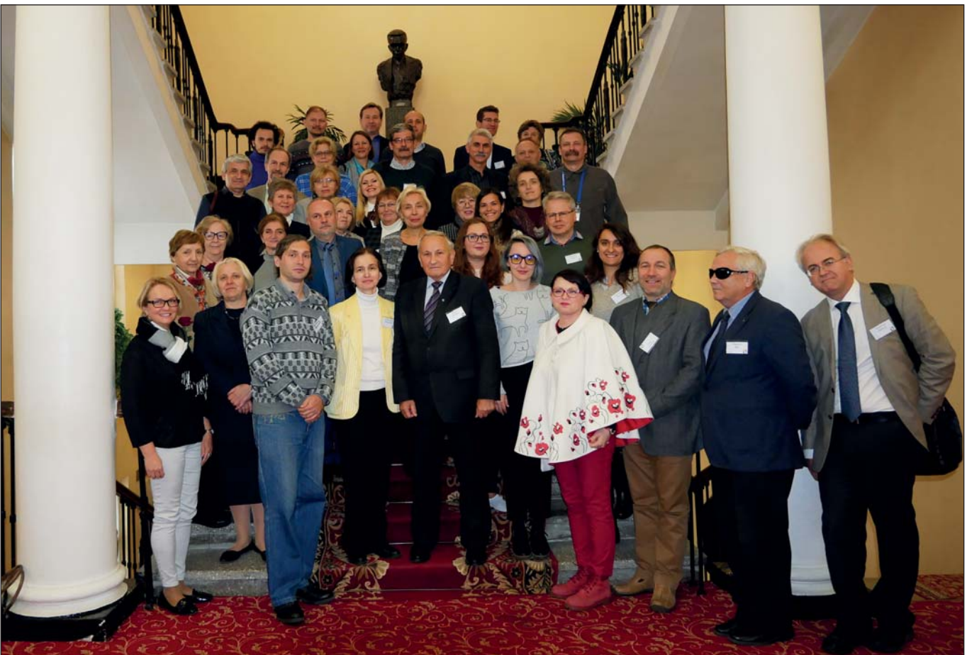
Фото на згадку. Учасники Форуму української наукової діаспори. Київ, 22 жовтня 2018 р.

– Очевидно, має активніше розвиватися міжнародна наукова співпраця. Останніми роками вона пошквалилася, але переважно завдяки безпосереднім контактам самих науковців.